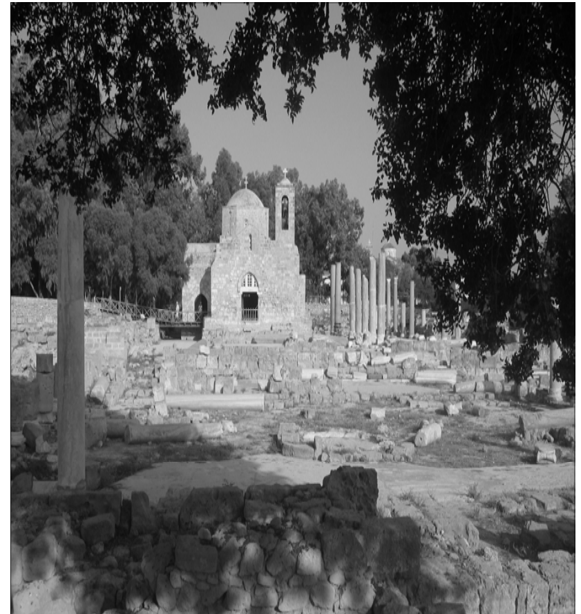
Agia Kyriaki, Paphos Kirche an der Paulus-Säule